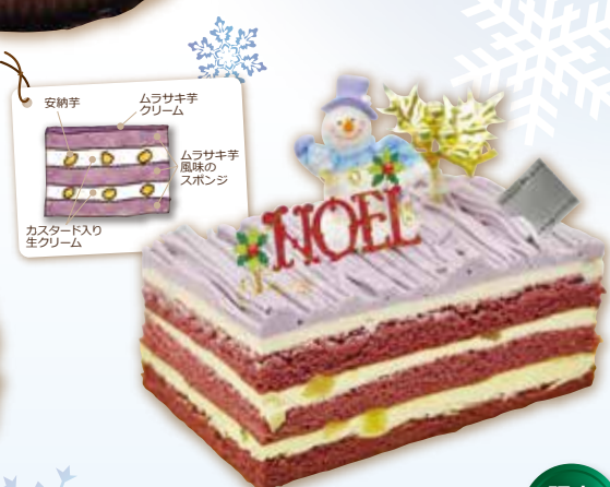
ムラサキイモのモンブラン 15×10cm 2,700円(税込)