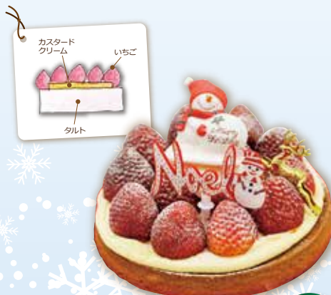
苺のタルト 15cm 3,500円(税込)