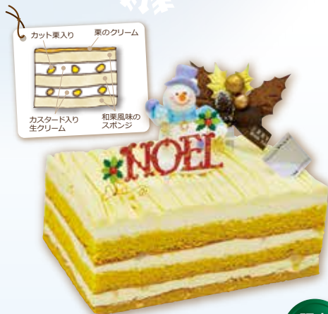
栗のモンブラン 15×10cm 2,700円(税込)