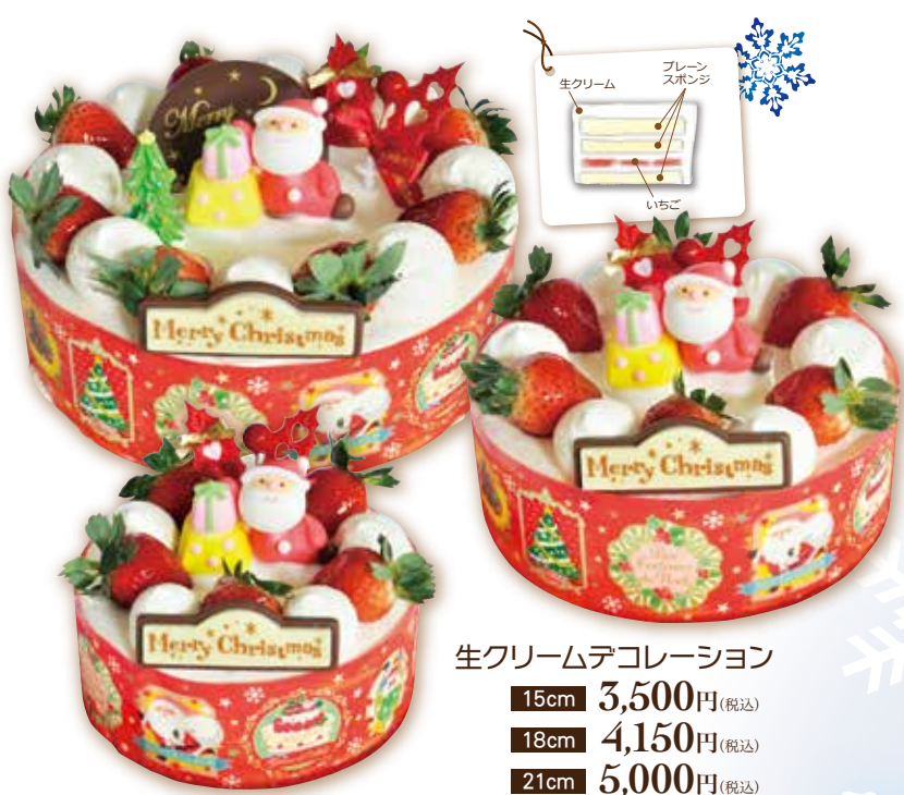
生クリームデコレーション 15cm 3,500円(税込) 18cm 4,150円(税込) 21cm 5,000円(税込)