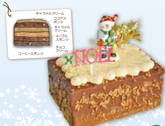
キャラメルショコラ 15×10cm 2,700円(税込)