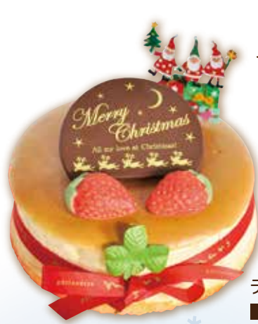
チーズスフレ 14cm 2,800円(税込)