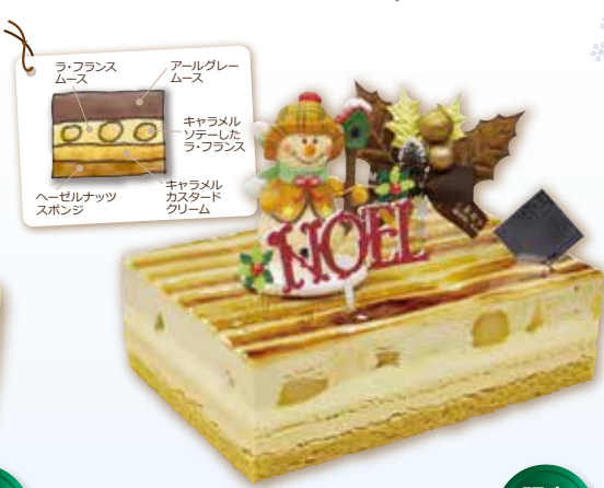
キャラメルポワールティー 15×10cm 2,700円(税込)