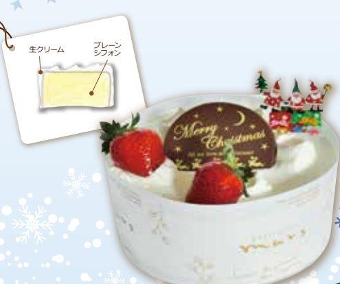
シフォンケーキ(プレーン) 15cm 1,850円(税込)