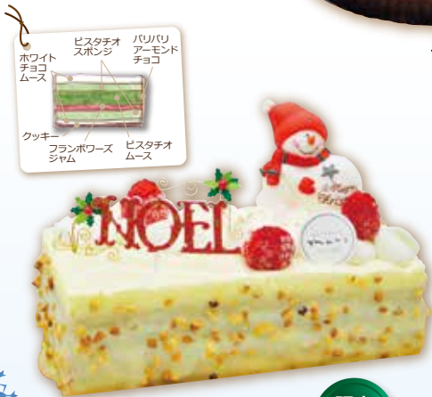
アルモニー 7.5×16cm 2,550円(税込)