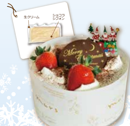
シフォンケーキ(ショコラ) 15cm 1,850円(税込)