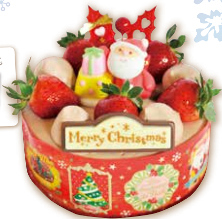
生チョコデコレーション 15cm 3,500円(税込) 18cm 4,150円(税込) 21cm 5,000円(税込)