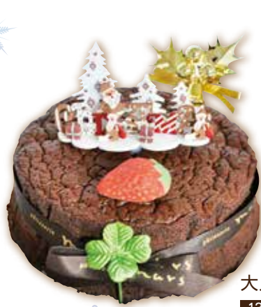
大人のチョコスフレ 13cm 2,800円(税込)