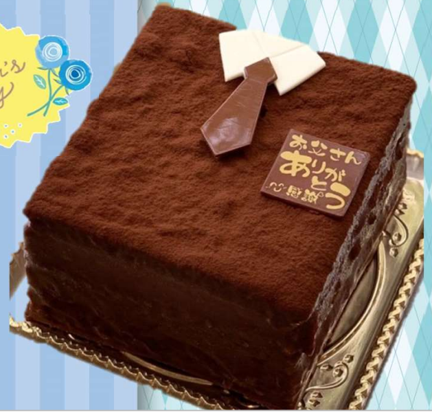
下からコーヒースポンジ、チョコクリーム、 メープルスポンジ、バニラクリーム、 ココアスポンジをチョコレートでコーティング ネクタイケーキ 11cm 2,800円(税込)