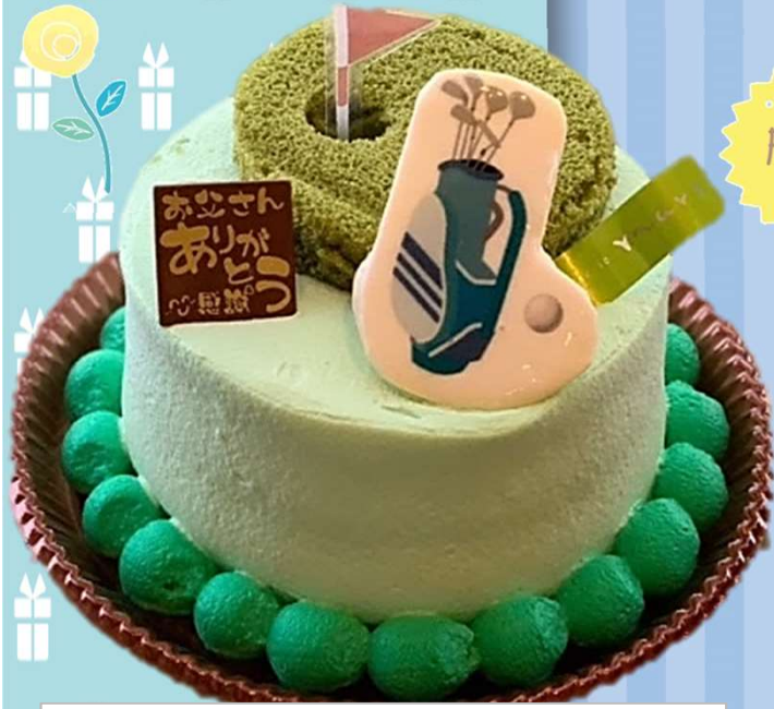
苺サンドした生クリームデコレーションケーキ ゴルフケーキ 12cm 2,800円(税込)